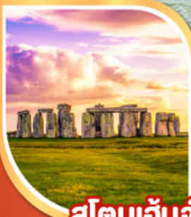
สโตนเฮ็นจ์