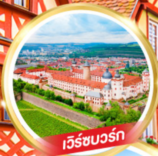
เว็ร์ชบวร์ค