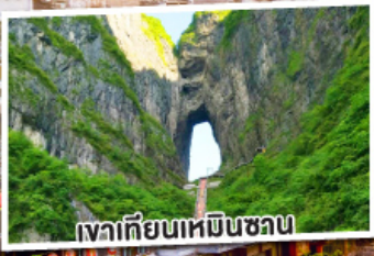
เวาเทียนเหมินซาน