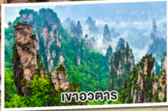
เหวอวตาร