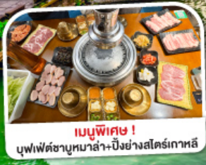
เมนูพิเศษ! บุฟเฟ่ต์ชาบูหม่าล่า+บิงย่างไส้กรอกเกาหลี