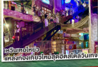
เที่ยวช้อปปิ้ง แหล่งท่องเที่ยวใหม่สุดฮิตสไตล์ล่องแก่ง