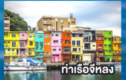
ท่าเรือจีหลง