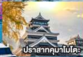
ปราสาทคุมาโมโตะ