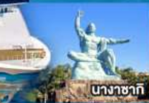
นางาซากิ