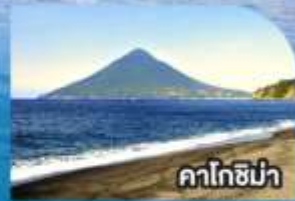
คาโทชิมา