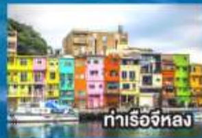
ท่าเรือหลง