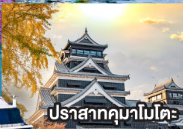
ปราสาทคุมาโมโตะ