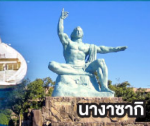
นากาซากิ