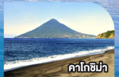
คาโกชิมา