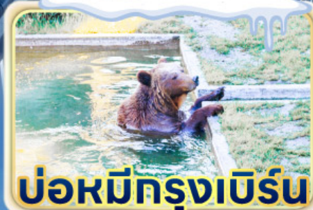
ป้อมมีกรุงเบิร์น