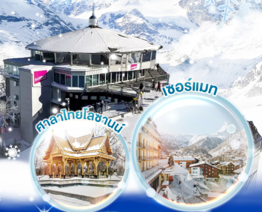
ศาลาไทยโลซานน์