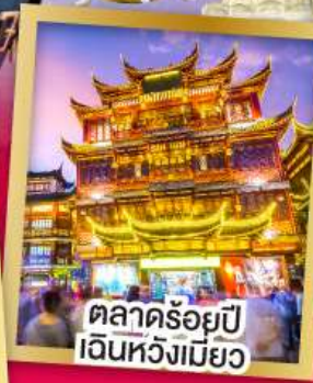
ตลาดร้อยปี เงินหังเหมียว