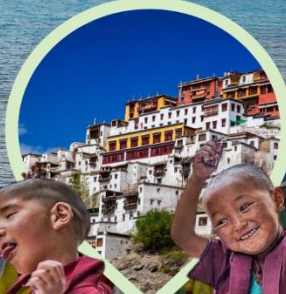
วัดธิเบตนิคายมหายาน หมวกแดง หมวกเหลือง