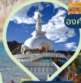
เจดีย์สันติภาพ