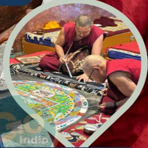
พระลามะ ผู้มีวัตรปฏิบัติ อันอัศจรรย์