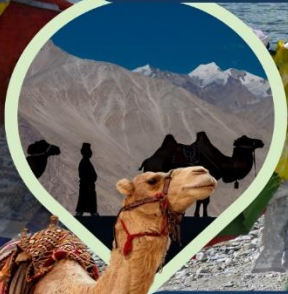
ซิลลี่ ซ็อซู ทะเลทราย กลางอ้อมกอดหิมาลัย