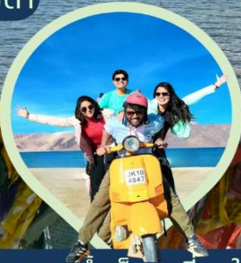
ทะเลสาบน้ำเค็มสูงที่สุดในโลก แปงกอง