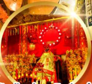
วัดเจ้าแม่กวนอิมฮ้องฮำ