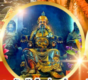
วัดปักโตฮ้องฮำ