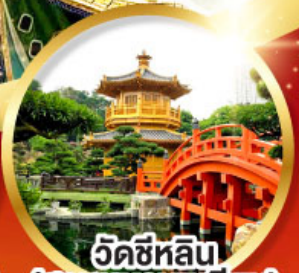
วัดชหลิน