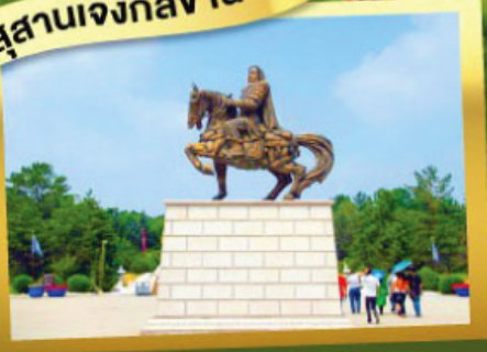
เนินทรายสีงชาวน