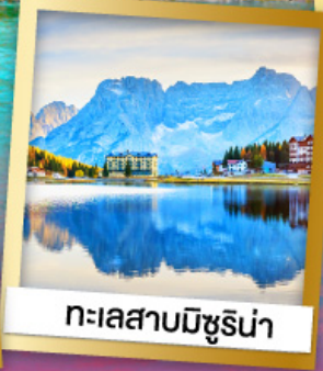
ทะเลสาบมิชุนีน่า