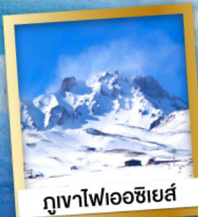
ภูเขาไฟเอซียส์