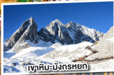
เขาสหิมะมังกรหยก