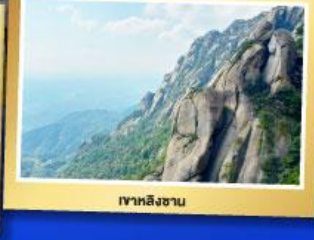
เขาลิงซาน