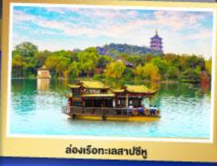
ล่องเรือทะเลสาปซีหู