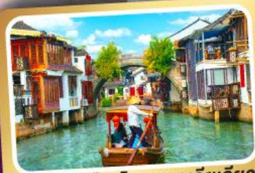
ล่องเรือเมืองโบราณซูโจวเจียว