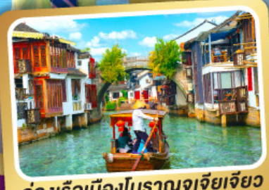
ล่องเรือเมืองโบราณจูเจียเจียว