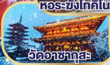
วดอชากุสะ