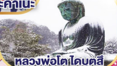
หลวงพ่อดาโดบุตสึ