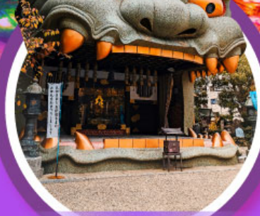
ศาลเจ้านิมบะ ยาชากะ