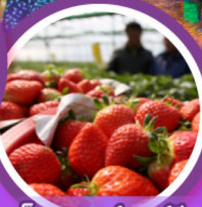
เก็บสดรอว์เบอร์รี่

เดินทาง 04-09, 06-11 ก.พ. 68 14-19, 18-23 ก.พ. 68