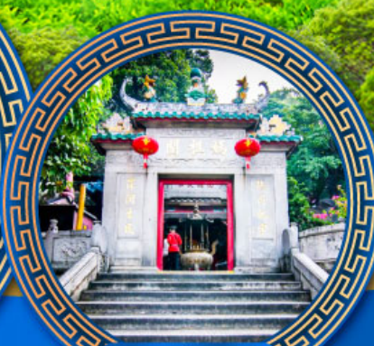
วัดอามา มาเก๊า