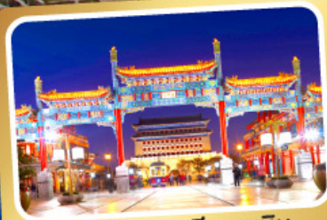
ถนนโบราณเทียนเหมิน