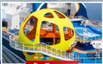
วันเดินทาง