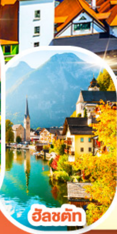
อินส์บรอก