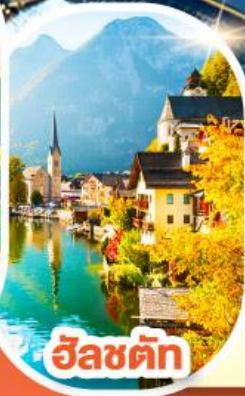
อินส์บรอก