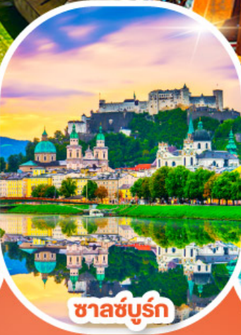
ซาลซ์บูร์ก