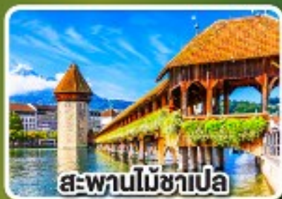
สะพานไม้อาเปลา