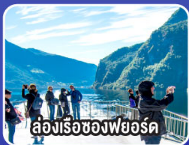
ล่องเรือช่องฟยอร์ด