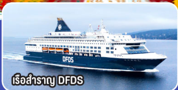
เรือสำราญ DFDS