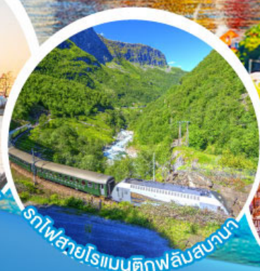
รถไฟสายโรแมนติกฟลัมสบานา