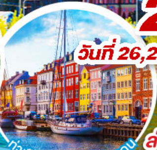
ท่าเรือฮาวน์.โตปเปอเทม