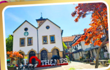
เทมส์ทาวน์