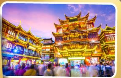
ตลาดร้อยปีเวียงหวังเมี่ยว

สนุกสนานมันส์ไปกับเครื่องเล่น Shanghai Disneyland เต็มวัน