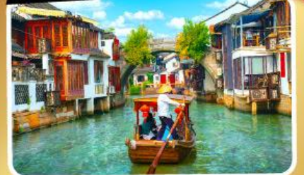
เมืองโบราณจู่เจียเจียว