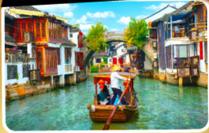
เมืองโบราณซูโจวเจียเจียว