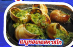
เมนูหอยแอสคาร์โท