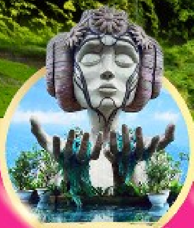
โมอาน่า ซาปา คาเฟ่