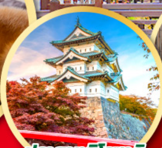
ปราสาทอิโรฮาเกะ