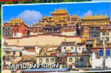
วัดลามะ-ชิงช่าป๋อหลิง

แซงกรี่ล่า บินภายใน 1 เที่ยวบิน 5 วัน 4 คืน ไม่ลงร้านช้อปปิ้ง ไม่จ่ายออฟชั่น