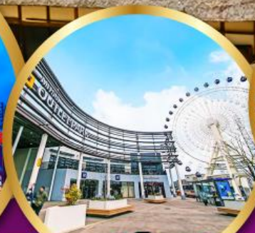
มิตซูเอากะไลท์พาร์ค เซนได