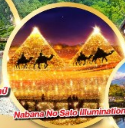
Nabana No Sato Illumination