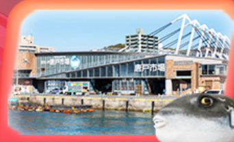
KARATO FISH MARKET