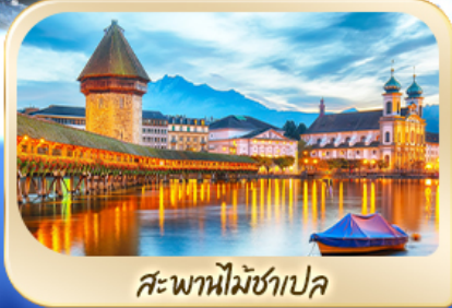
สะพานไมซ์าเปล