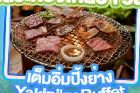
เติมอัมปิ้งย่าง Yakiniku Buffet