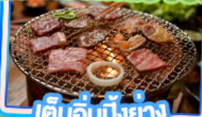
เต็มอิ่มปิ้งย่าง Yakiniku Buffet