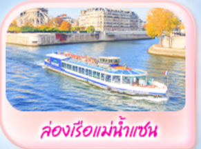
คลองเรือแม่น้ำแซน