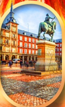
พลาซามายอร์