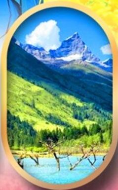
อุทยานสี่ตุรกี