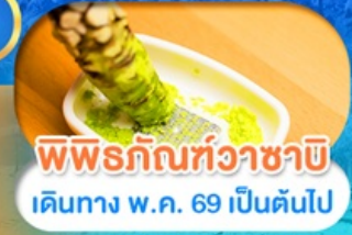
พิพิธภัณฑสถาน เดินทาง พ.ศ. 69 เป็นต้นไป