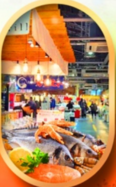
ตลาดปลาฮงโศ