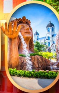
น้ำตกเทพพิหญิง