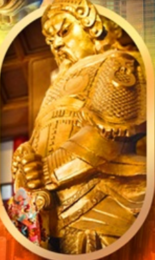
ทองพรวัดแซง