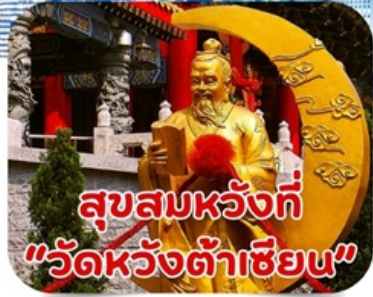
สุขสมหวังที่ "วัดหวังต้าเซียน"

*ราคาเริ่มต้นที่ 4,555.- บาท/ท่าน วันนี้-ธ.ค.67