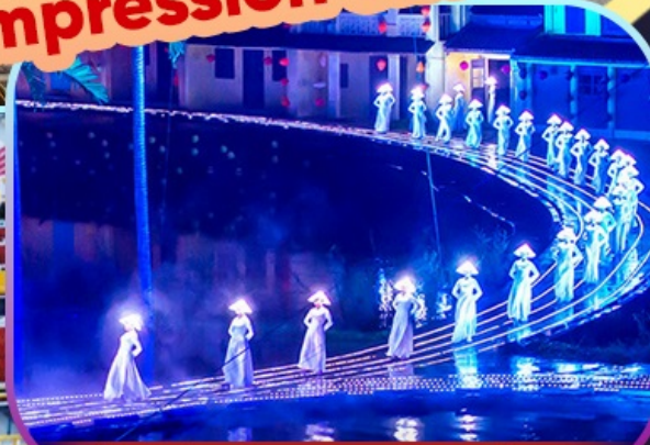
Hoi An Impression Show