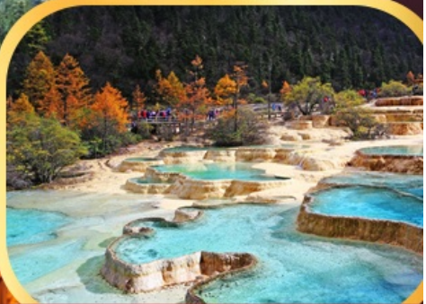
อุทยานหวงหลงมรดกโลก