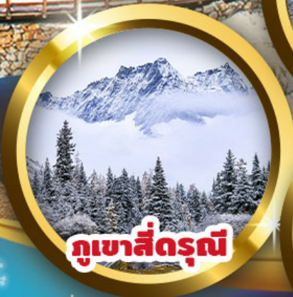
ภูเขาสี่ดรุณี