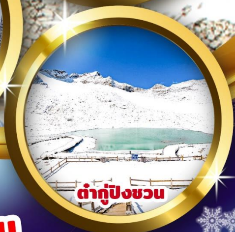
ต้ากู่ปิงชวณ