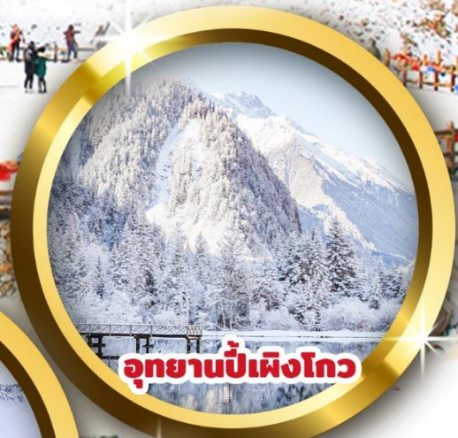
อุทยานปี้ผิงโกว