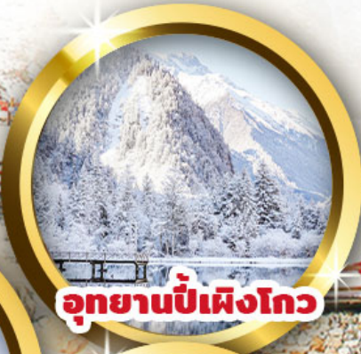
อุทยานปี้เฟิงโกว