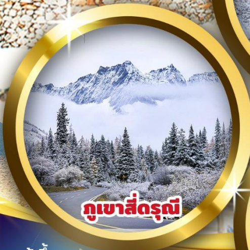
ภูเขาสี่ดรุณี