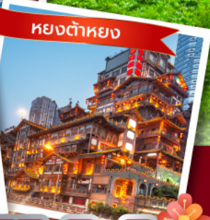
หยงต๋าหยง