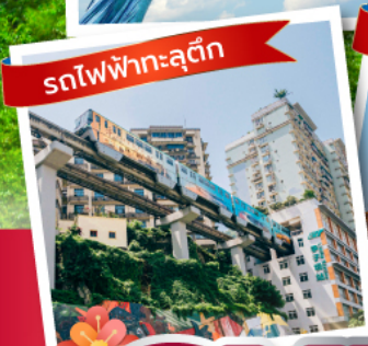
รถไฟฟ้าลู่ตึก