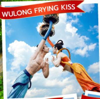
WULONG FRYING KISS