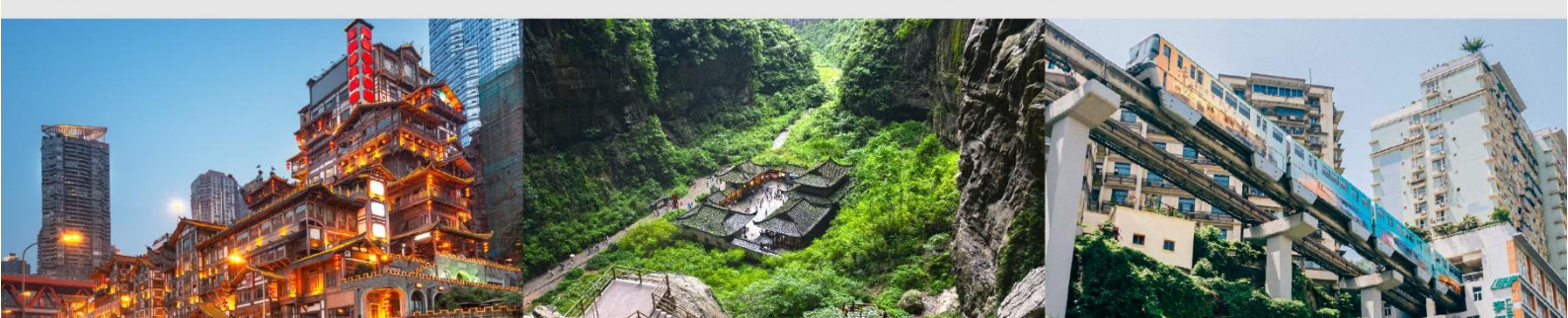
หงหยาดัง