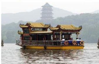
ล่องเรือชมทะเลสาบซีหู