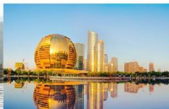
QIANJIANG NEW CITY