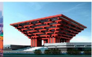
CHINA ART MUSEUM

*ทางบริษัทฯ ขอสงวนสิทธิ์ในการสลับโปรแกรมทัวร์ตามความเหมาะสมขึ้นอยู่กับสถานการณ์ปฏิบัติงาน โดยคำนึงถึงผลประโยชน์ของลูกค้าเป็นสำคัญ