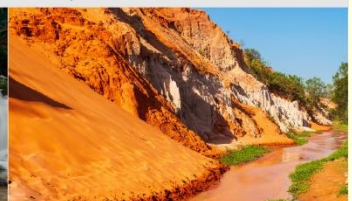
ลำธารนางฟ้า

*ทางบริษัทฯ ขอสงวนสิทธิ์ในการสลับโปรแกรมทัวร์ตามความเหมาะสมขึ้นอยู่กับสถานการณ์หน้างาน โดยคำนึงถึงผลประโยชน์ของลูกค้าเป็นสำคัญ