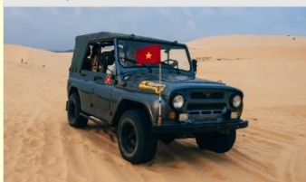
ทะเลทรายขาว