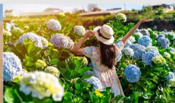
สวนดอกไฮเดรนเยีย