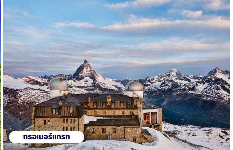
กรอเนอร์กรัท