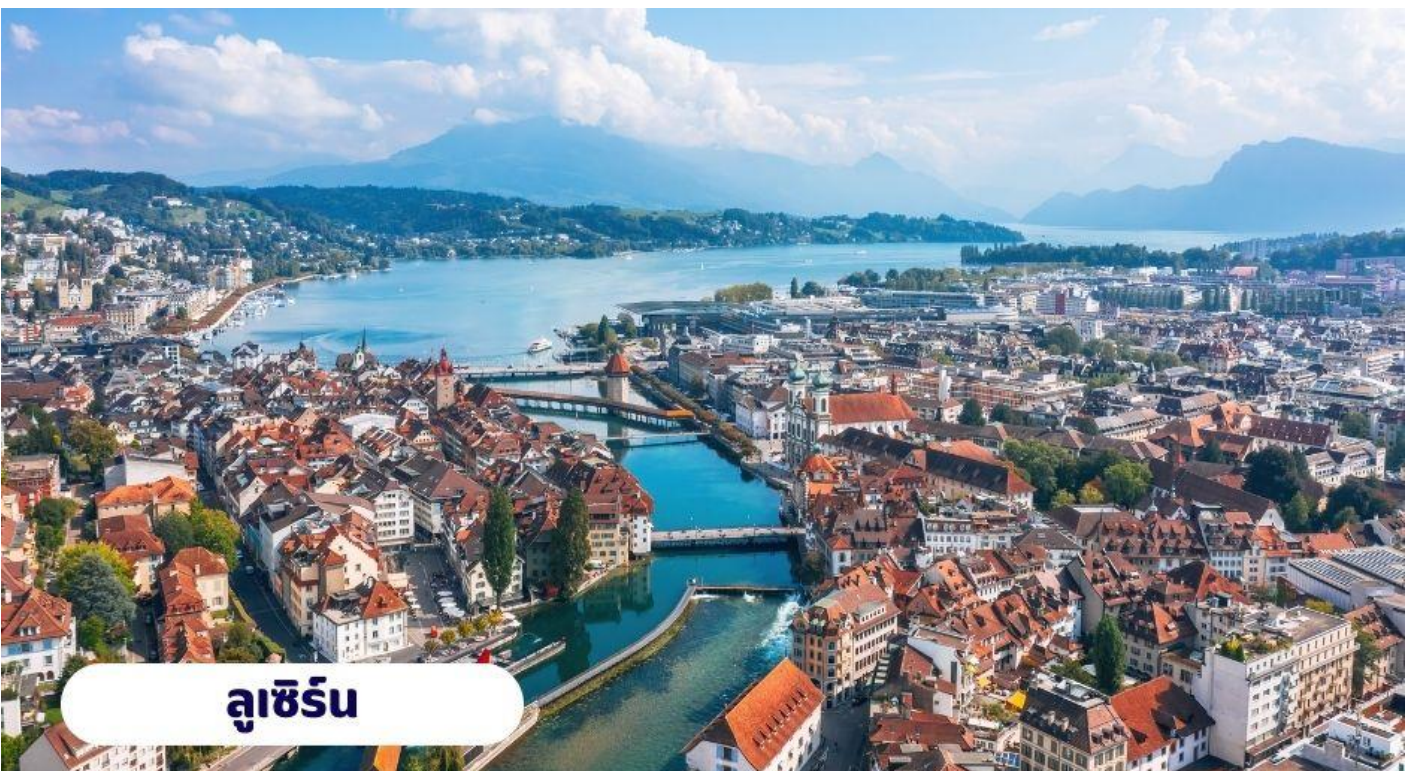
ลูเซิร์น

แปดเหลี่ยมกลางน้ำ จ้าวแต่ละช่องของสะพานจะมีภาพเขียนเรื่องราวประวัติความเป็นมาของประเทศสวิสเซอร์แลนด์ เป็นภาพเขียนเก่าแก่อายุกว่า 400 ปี แต่น่าเสียดายที่ปัจจุบันสะพานไม้นี้ถูกไฟไหม้เสียหายไปมาก ต้องบูรณะสร้างขึ้นใหม่เกือบหมด จากนั้นนำท่านเที่ยวชม รูปแกะสลักสิงโตบนหน้าผาหิน เป็นอนุสาวรีย์ที่ตั้งอยู่ใจกลางเมืองที่หัวของสิงโตจะมีโล่หุ้ม ซึ่งมีกากบาทสัญลักษณ์ของสวิสเซอร์แลนด์อยู่ อนุสาวรีย์รูปสิงโตแห่งนี้ออกแบบและแกะสลักโดย ธอร์ วอลเสน ใช้เวลาแกะสลักอยู่ราว 2 ปี ตั้งแต่ ค.ศ. 1819-1821 โดยสร้างขึ้นเพื่อเป็นเกียรติแก่ทหารสวิสฯ ในด้านความกล้าหาญ ชื่อสัตย์ จงรักภักดี ที่เสียชีวิตในประเทศฝรั่งเศส ระหว่างการต่อสู้ป้องกันพระราชวังในครั้งปฏิวัติใหญ่สมัยพระเจ้าหลุยส์ที่ 16