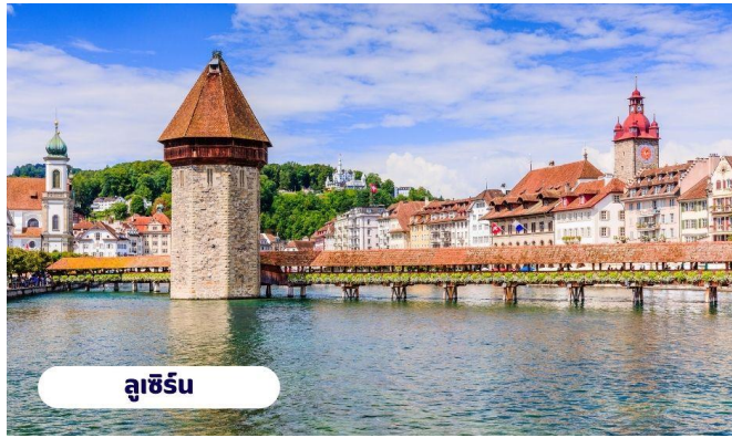
ลูเซิร์น

📌 บริการอาหารกลางวัน ณ ภัตตาคาร จากนั้นนำท่านเดินทางสู่ เมืองลูเซิร์น ใช้เวลาเดินทางประมาณ 1 ชั่วโมง อดีตหัวเมืองโบราณของสวิสเซอร์แลนด์ เป็นดินแดนที่ได้รับสมญานามว่า หลังคาแห่งทวีปยุโรป (The roof of Europe) เพราะนอกจากจะมีเทือกเขาสูงเสียดฟ้าอย่างเทือกเขาแอลป์แล้ว ก็ยังมีภูเขาใหญ่น้อยสลับกับป่าไม้ที่แทรกตัวอยู่ตามเนินเขาและไหล่เขา สลับแซมด้วยดงดอกไม้ป่าและทุ่งหญ้าอันเขียวชอุ่ม จากนั้นนำท่านชมและแวะถ่ายรูปกับ สะพานไม้ชาเปล หรือสะพานวิหาร (Chapel bridge) ซึ่งข้ามแม่น้ำ