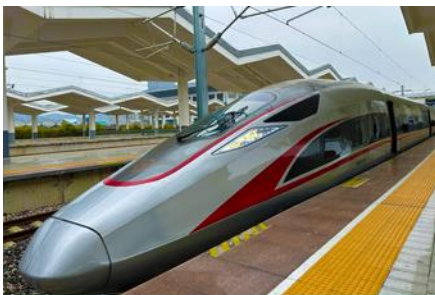
นิ้รรถไฟความเร็วสูง

พักที่ RAYFONT HOTEL CHENGDU โรงแรมระดับ 4 ดาวท้องถิ่นหรือเทียบเท่าในเมืองเฉิงตู